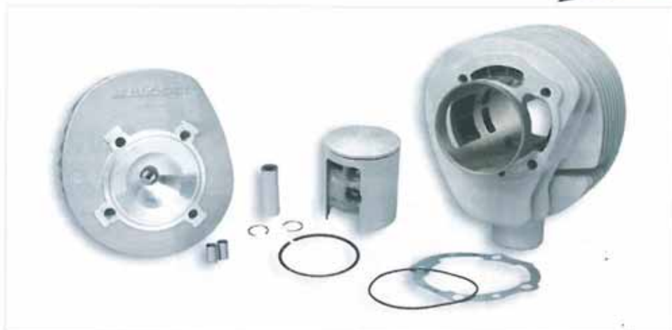
Componentes de motor Malossi para Vespa. Vicma los ha incorporado recientemente a su extenso portafolio de producto.

en su catálogo todo tipo de recambios como manetas, frenos, retrovisores, cerraduras y ópticas para modelos Vespa de 1946 en adelante, tanto para los modelos más populares como la Primavera, Special, Sprint 150, P200E o PX así como para los más complicados de encontrar como la Rally, SS, Sprinter, Racer, V98, etc.