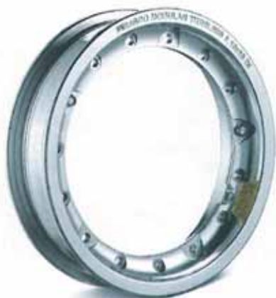
Llantas tubulares TUV en aluminio y desmontables. Uno de los productos más destacados de Pinasco para Vespa. Dmot Gestión es el distribuidor de Pinasco en España.

Escapes: amplia oferta en escapes la de Pinasco que propone, desde el clásico escape para la Vespa Primavera hasta modelos de diseño y desarrollo exclusivo para su instalación en modelos que compiten en campeonatos internacionales. Por todo lo descrito, queda claro que Pinasco es una marca imprescindible a la hora de personalizar cualquier modelo Vespa. Y su distribuidor en España es Dmot Gestión.