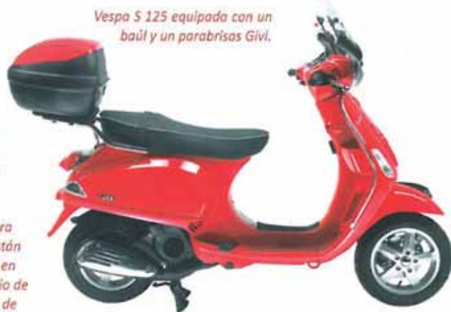
Vespa S 125 equipada con un baúl y un parabrisas Givi.