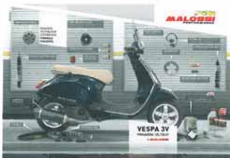
Como muy bien ilustra la imagen, es muy amplia la gama de componentes Malossi para Vespa.