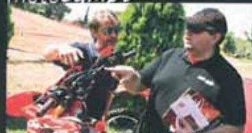
Modelos Beta 2017