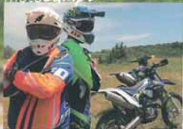
Gama Sherco 2017