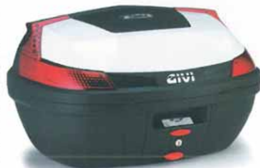
El baúl B47 Monolock se puede elegir en diferentes colores. El de la imagen es blanco.

SU PROPUESTA La firma de origen italiano busca incrementar la capacidad de carga y el confort de marcha de los propietarios de una Vespa al ofrecerles varias referencias en baúles y parabrisas. Así, hasta con 47 litros de capacidad se presenta el modelo de baúl B47 Monolock el cual es capaz de albergar hasta dos cascos integrales. Se puede escoger en varios colores y se equipa con catadióptricos ahumados y rojos, parrilla y kit de fijación por debajo. La opción más versátil es el B37 Monolock de 37 litros de capacidad que puede acoger un casco integral y que también incluye los catadióptricos, la parrilla y el kit. Los más asequibles son los B33 Monolock y B27 Monolock de 33 y 27 litros respectivamente. Ambos pueden albergar un casco integral y se equipan con la parrilla y un kit de fijación universal. En cuanto a los parabrisas, para la Vespa Primavera 50-125 dispone del modelo 5608A transparente de 50x69 centímetros; para las LX 50-125 y GTS 125-300, del 104A transparente de 51,5x69,5 centímetros y para la S 50-125-150, del 355A transparente con serigrafía de 60x69 centímetros. Los tres modelos de pantallas se comercializan con anclajes específicos para su montaje.