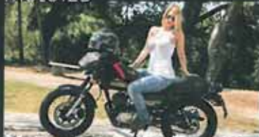
Hanway Cafe Racer