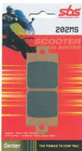
Pastillas de freno SBS para scooters y, por tanto, para Vespa. Están incluidas en el portfolio de producto de Euromoto 85.

El elenco de recambios y accesorios para Ves-